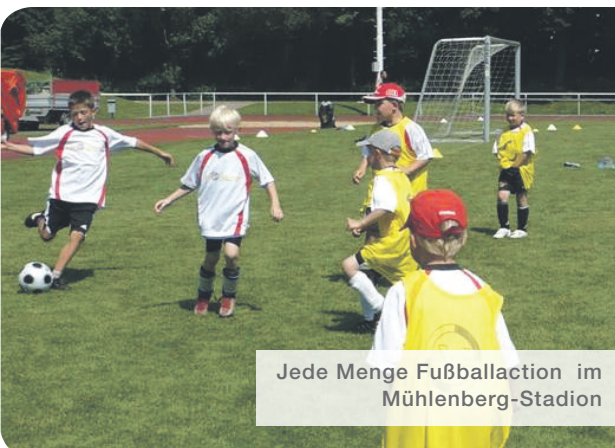
Jede Menge Fußballaction im Mühlenberg-Stadion