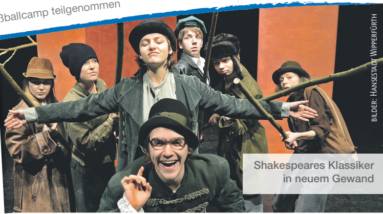
Shakespeares Klassiker in neuem Gewand